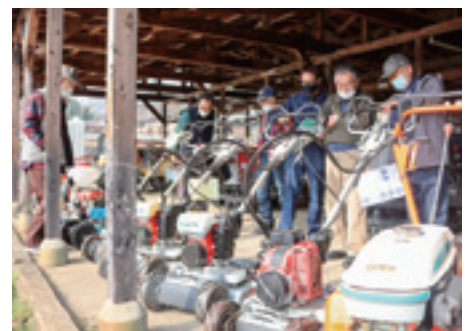
▲中古農業機械を確認する来場者

JAは3月10日、11日、庄原市の旧庄原家畜市場で中古農機展示会・墓石展示予約会を開きました。厳選した中古農業機械約90台と墓石15基を展示・販売し、約300人が訪れました。 JAグループが2020年10月から受注する中型共同購入トラクターも展示し、農具なども販売しました。農業融資コーナーも設け、生産者の相談にも応じました。60代の農業生産法人の関係者は「中古農機具の需