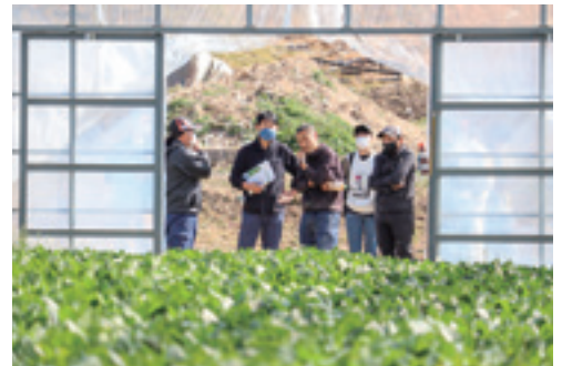
▲ハウレンソウの生育を確認する生産者

甲奴郡ほうれんそう生産部会は3月15日、三次市甲奴町のグリーンカウベルで栽培研修会を開きました。生産者や県東部農業技術指導所、JAなど19人が参加。ハウレンソウの品種特性や生産資材、病害虫防除などを確認し、春から夏に向け良品出荷を申し合わせました。 種苗メーカーが試験結果や品種特性、品種選定のポイントについて説明しました。気温が上昇する春夏の良品栽培に向けて、遮光資材や環境負担を軽減