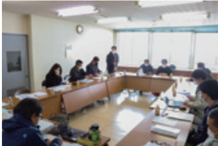
▲ブランド化などでも意見交換しました

高野町野菜組合とまと部会は3月2日、JA高野支店で2023年産の栽培研修会を開きました。生産者や県農業技術指導所、JAなどの13人が参加しました。 2022年産は前年比8%増の390t、販売金額は同20%増の1億2135万円を記録。規格と品質を統一し、市場ニーズに応える出荷で、平均単価を1kg当たり31円引き上げました。研修会で県は、県内の夏秋産地でも確認されたトマト褐色輪